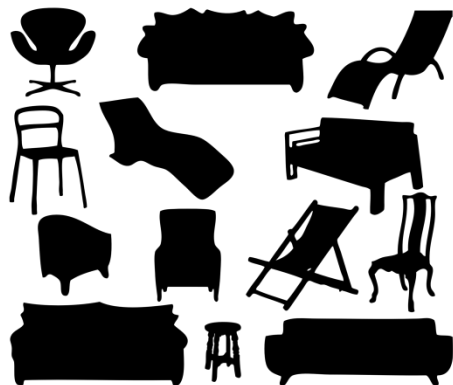
Obrazki do zabawy

Obrazki możesz wydrukować, wyciąć i rozłożyć na dywanie. Wybierz wzrokiem obrazek, wypowiedz nazwę przedmiotu, głoskując ją. Kolejny obrazek wybiera rodzic wypowiada nazwę głoskując, dziecko ma za zadanie wskazać właściwy obrazek (dzieci młodsze mogą dzielić na sylaby).